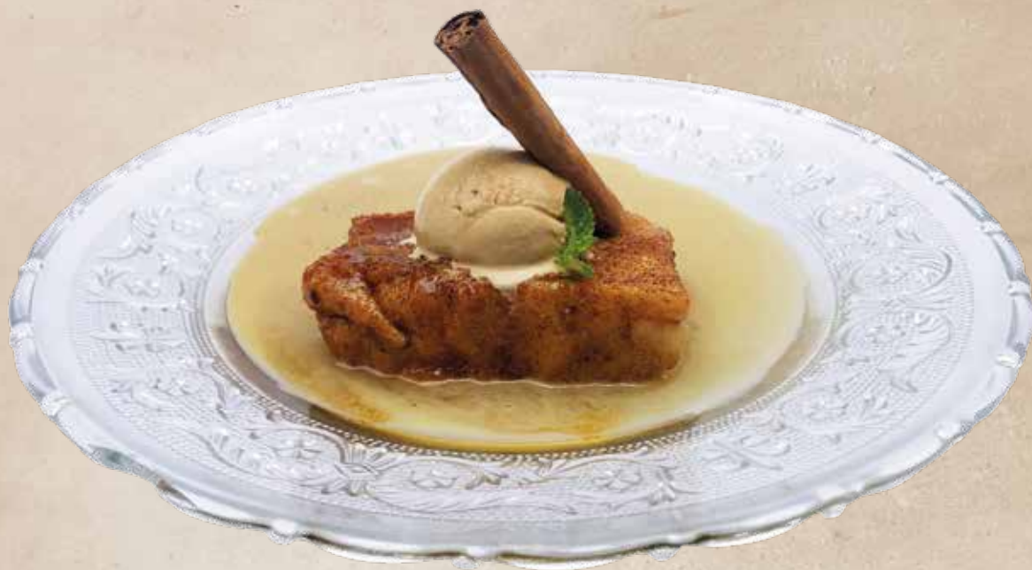
Torrija con crema de café y helado de caramelo salado | 5,90€ "Torrija" amb crema de cafè i gelat de caramel salat