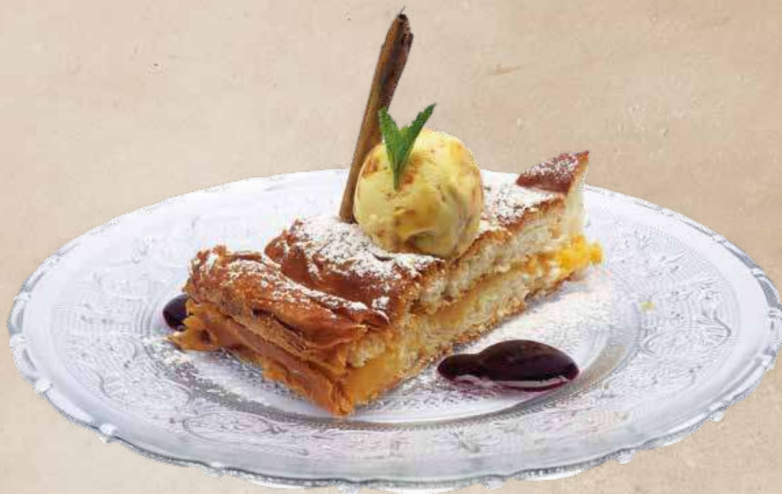
Ensaïmada menorquina de crema con helado de crema catalana | 5,90€ Ensaïmada menorquina de crema amb gelat de crema catalana