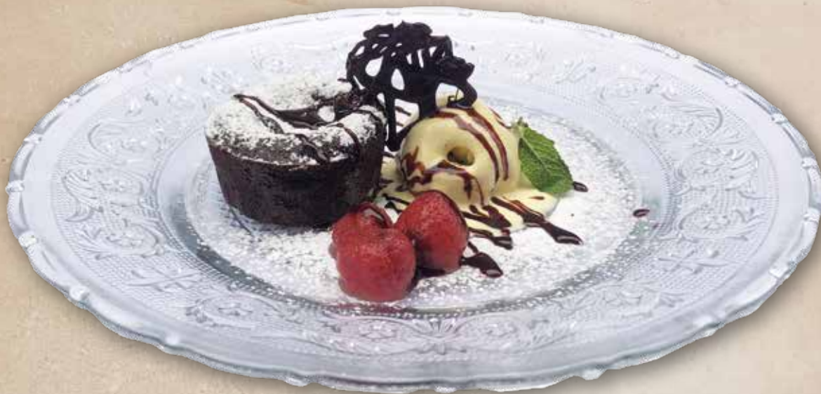
Coulant de chocolate negro y helado de vainilla | 5,90€ Coulant de xocolata negra i gelat de vainilla