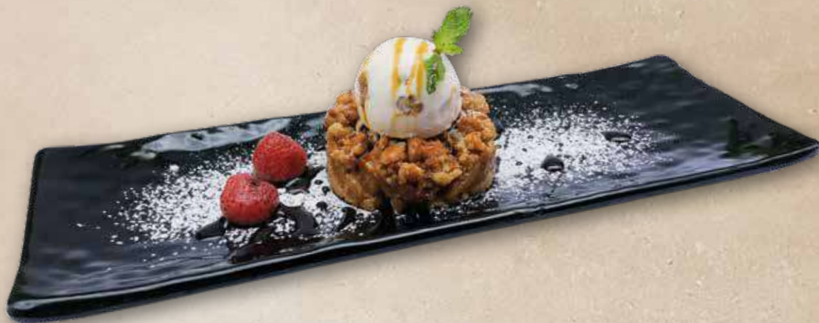
Crumble de manzana golden con helado de nueces | 5,90€ Crumble de poma golden amb gelat de nous