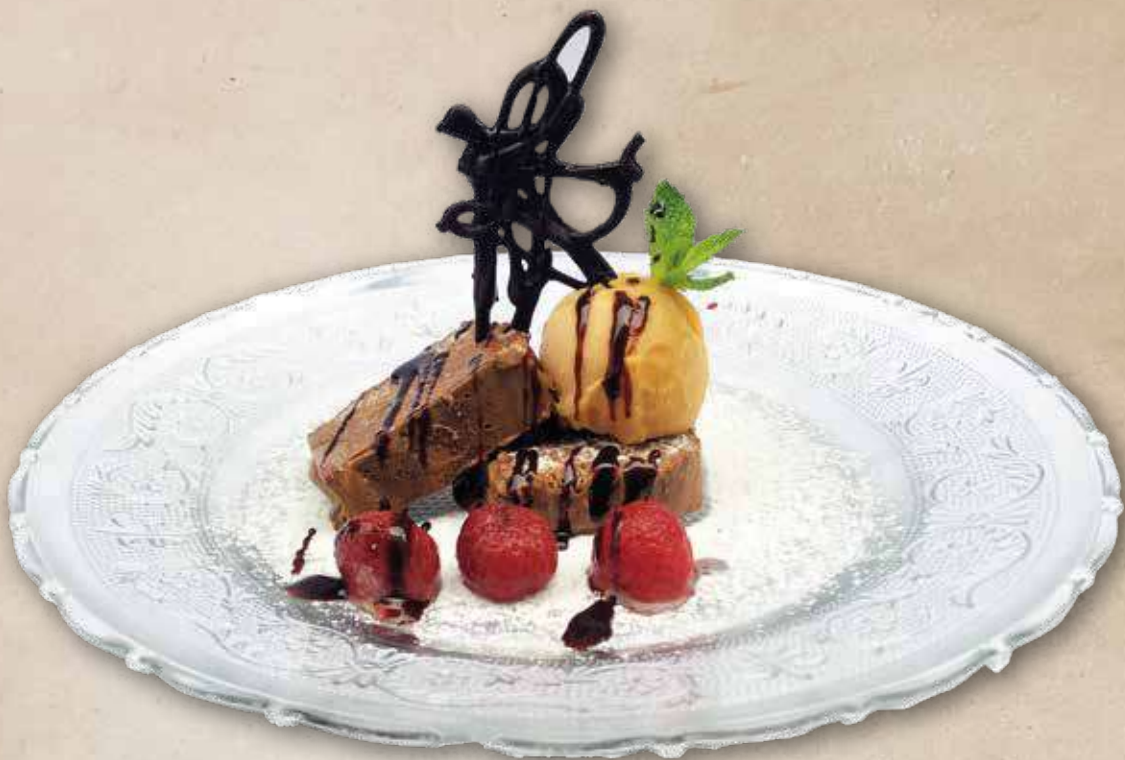
Parfait de chocolate belga 70% con sorbete de mandarina | 5,90€ “Parfait” de xocolata belga 70% amb sorbet de mandarina